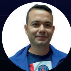
GIL TABARES JUAN GABRIEL